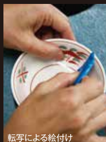
転写による絵付け