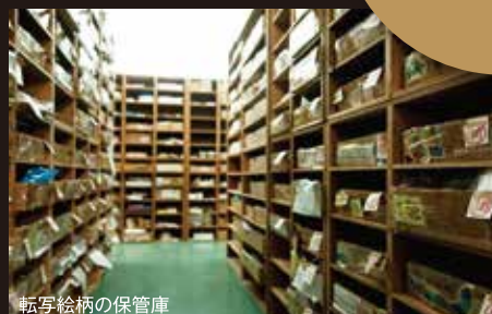
転写絵柄の保管庫